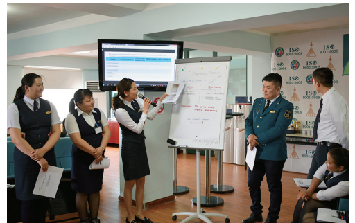
社会保障事務局の担当者による窓口業務改善に係る提案事項の発表の様子

モンゴルでは、年金をはじめとした社会保障制度について、職種間や世代間での公平性を確保しながら、いかに加入者を増やし、持続的な制度を形成するかが課題となっています。JICAは、社会保障事務官の保険料徴収業務の改善や社会保障制度の広報強化を支援したほか、現在は、高齢化等を踏まえた人口動態予測や税収予測に基づいた年金制度の財政検証が行われるよう、労働・社会保障省の職員の能力強化に取り組んでいます。